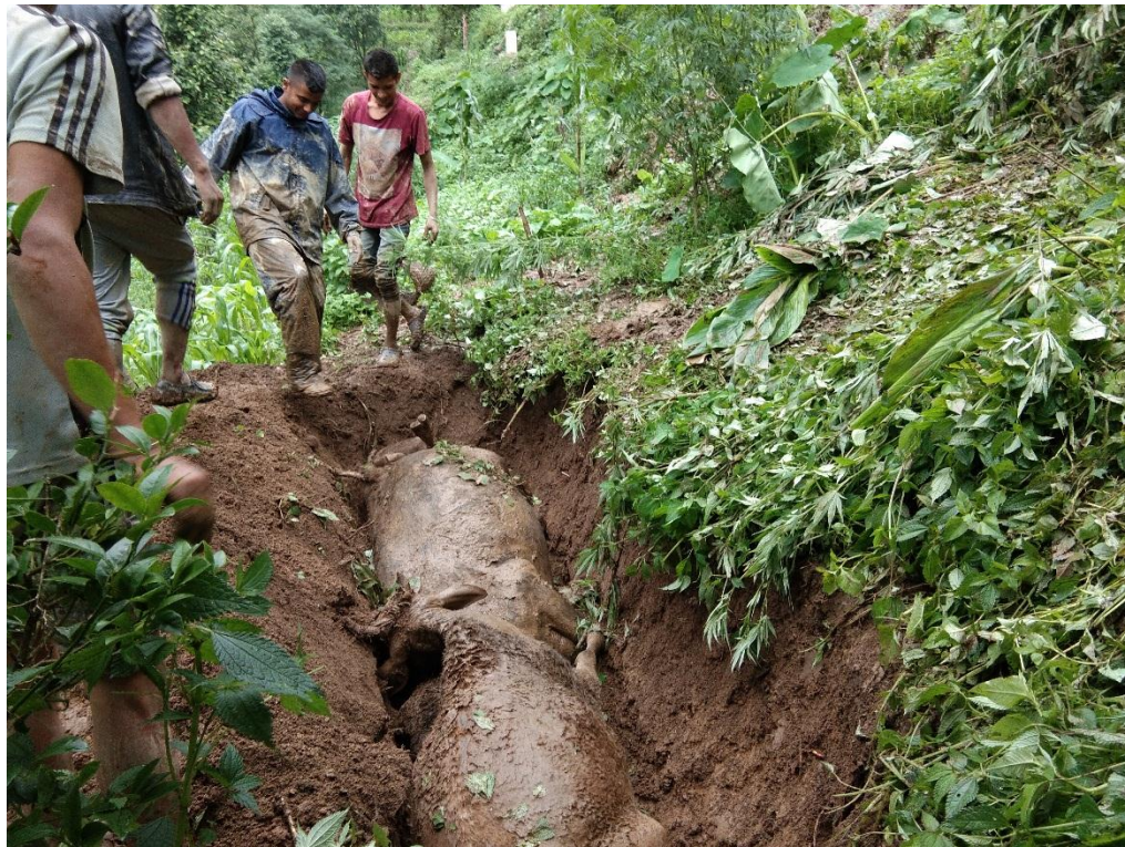
वाहीमा परि मरेका पशु चौपायाहरुलाई खाडलमा पुर्ने काम